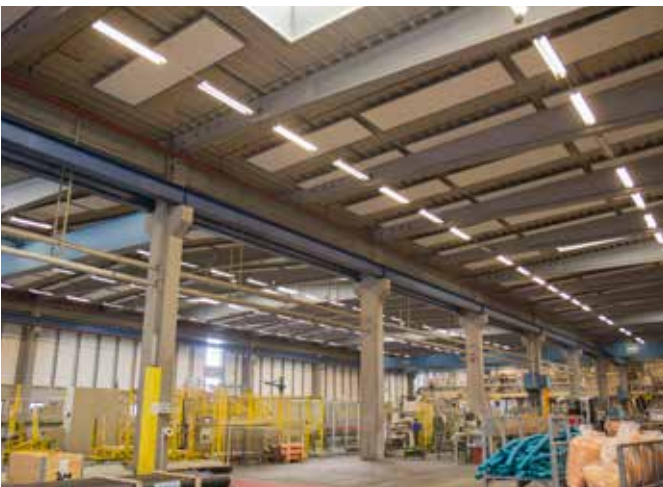
Lofts- og vægpaneler