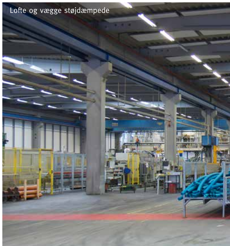
Lofte og vægge støj dæmpede